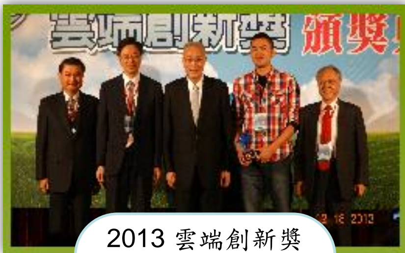
2013 雲端創新獎 副總統到場頒獎