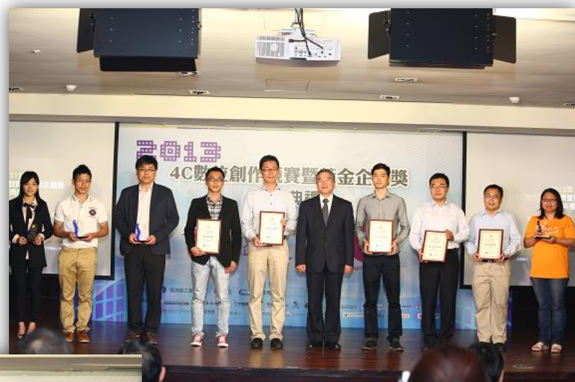
2013 黃金企鵝獎 頒獎典禮